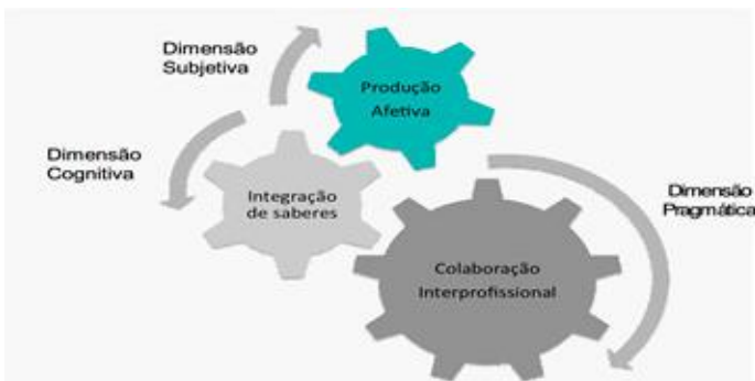
Figura 1 - Estrutura Conceitual da Interprofissionalidade

A concepção de interprofissionalidade formulada no presente artigo apresenta a estrutura conceitual, representada na Figura 1.