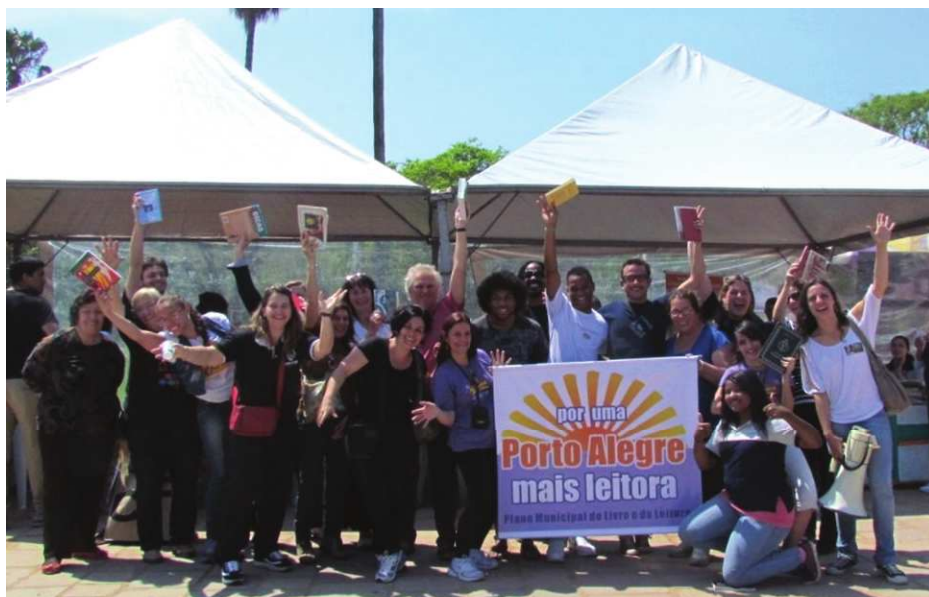
Figura 1: Livroço realizado em 17 de abril de 2015, na Redenção

No dia 17 de abril de 2011, amantes do livro, da leitura e da literatura realizaram uma leitura coletiva no parque da Redenção, o Livroço, que contou com a adesão de cerca de duzentas pessoas, que, amorosamente, mostraram que é possível promover uma cidade mais leitora, por meio de ações públicas e privadas. Até hoje outras edições do Livroço fizeram e fazem parte da luta pelas políticas públicas do livro na cidade.