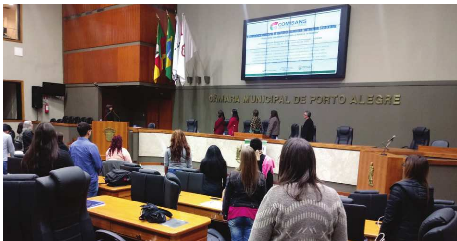
Figura 3. VI Conferência de Segurança Alimentar e Nutricional de Porto Alegre - 2019

Os desafios do COMSANS são muitos e bastante diversificados. Uma das principais dificuldades tem sido em relação aos encaminhamentos das deliberações da VI Conferência Municipal de Segurança Alimentar e Nutricional, de 2019, que foram apresentadas para o Prefeito de Porto Alegre em dezembro do mesmo ano. Até o mês de julho de 2020, o Executivo Municipal ainda não havia se manifestado no que se refere ao atendimento das principais proposições apresentadas no Relatório da Conferência.