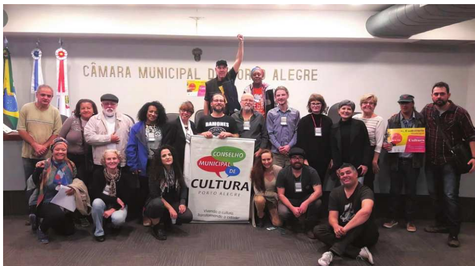
Figura 1: Pré-Conferência de Cultura, Câmara de Vereadores, 20/07/2019

Em relação ao FUMPOA, consistia em fundo destinado à restauração e conservação de imóveis tombados, ou seja, com valor cultural e cuja a integridade do prédio é protegida por lei. No caso de imóveis privados, o fundo possibilitava que os proprietários financiassem os recur-