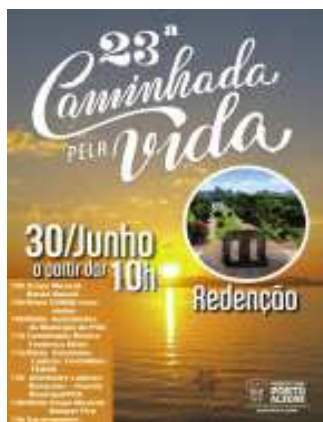
Figura 1: Cartaz da XXIII Caminhada Pela Vida realizada em 2019

O COMAD Porto Alegre, alinhado a esta Diretriz e integrado às atividades da Semana Gaúcha de Prevenção ao Uso de Drogas, realiza anualmente a Caminhada pela Vida dentro do Parque Farroupilha. A seguir o cartaz da XXIII Caminhada Pela Vida realizada em 2019.