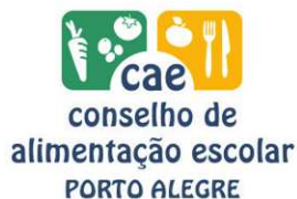
Figura 2: Logo do Conselho

Ao longo dos anos, o Conselho de Alimentação Escolar de Porto Alegre tem realizado diversos trabalhos de divulgação. Na gestão 2014-2018, foi idealizado o logo do conselho (Figura 2), pelo conselheiro Mauri Cruz, representante do segmento dos pais. À época, também foi construído o cartaz informativo do conselho (Figura 3).