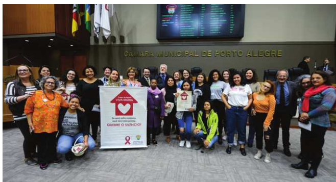
Figura 2: Comunicação temática sobre a Casa de Apoio Viva Maria, 03 de outubro de 2019