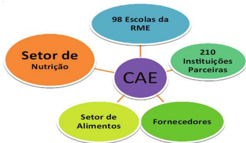
Figura 1: Imagem ilustrativa do universo de atuação do Conselho de Alimentação Escolar de Porto Alegre

A figura 1 ilustra o universo de atuação do CAE: