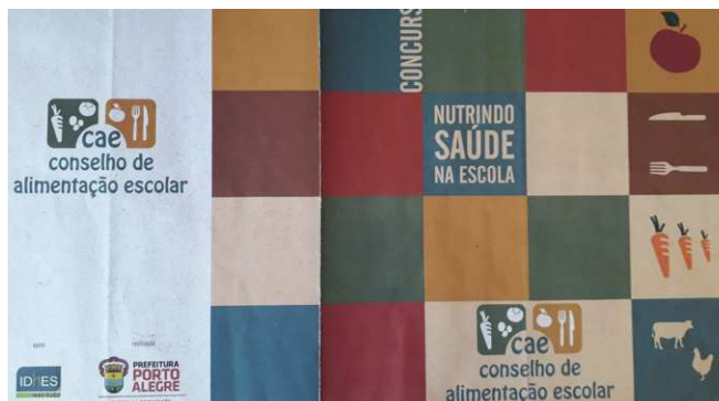
Figura 4: Imagem do folder de divulgação do concurso

Outra ação importante foi a realização, em 2014, do concurso “Nutrindo Saúde na Escola”, que visou estimular o debate, a criatividade e a consciência sobre a alimentação saudável dos alunos durante a sua permanência na escola, contribuindo para o seu crescimento e desenvolvimento físico e intelectual. A promoção de uma alimentação saudável no espaço escolar tem sido apontada mundialmente como uma das estratégias com maior poder de impacto na saúde da população. Para divulgação do concurso, foi elaborado um folder (Figura 4).