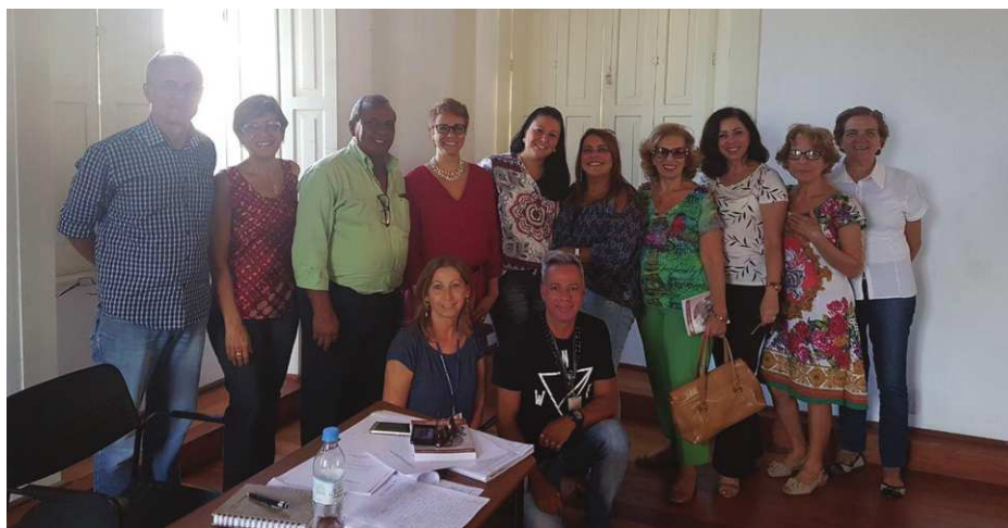
Figura 2: Plenária do COMSANS

Os membros do Conselho se reúnem mensalmente, na última quinta-feira do mês, pela manhã, em plenária ordinária, de maneira presencial ou virtual. A pauta de cada reunião é encaminhada com cinco dias de antecedência, junto com a Ata da plenária anterior. A Mesa Diretora tem reuniões quinzenais, com pautas de encaminhamento a partir das deliberações da plenária anterior e outros assuntos que porventura cheguem ao conhecimento do COMSANS.