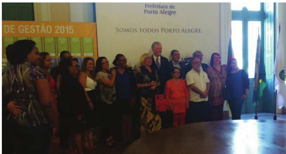
Figura 1: Posse do CMDH – Gestão 2015-2016, no Paço Municipal.

O mandato dos integrantes do Conselho Municipal de Direitos Humanos tem duração de dois anos, permitida a recondução. Os integrantes são nominados na Lei e cada organização indica o seu representante, conforme seus processos internos. Ou seja, temos desde indicação direta, caso dos representantes da Administração Municipal, até o sistema de escolha entre os pares, nas representações dos Movimentos Sociais. O núcleo de coordenação do CMDH é composto pela Presidência, Vice-presidência e uma Secretaria Executiva, que também tem mandato de dois anos. Esses representantes são eleitos entre os conselheiros em reunião ordinária do Conselho.