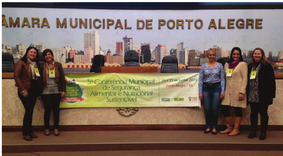
Figura 1: V Conferência de Segurança Alimentar e Nutricional de Porto Alegre - 2015

Durante esses anos de atuação, o COMSANS promoveu seis Conferências de Segurança Alimentar e Nutricional, nos anos de 2003, 2005, 2007, 2011, 2015 e 2019. Através das Conferências e de outras iniciativas, o COMSANS colaborou diretamente na formulação e deliberação das diretrizes para a política de Segurança Alimentar e Nutricional do Município e do Estado. Além disso, participou ativamente na elaboração de propostas para a efetivação do Programa de Aquisição de Alimentos do Governo Federal e para a implantação das Cozinhas Comunitárias (estruturas físicas de produção e oferta de refeição com capacidade de atender no mínimo 100 pessoas por refeição), que fazem parte da política nacional de Segurança Alimentar. Realizou ainda atividades de apoio à agroecologia e às comunidades tradicionais (indígenas e quilombolas).