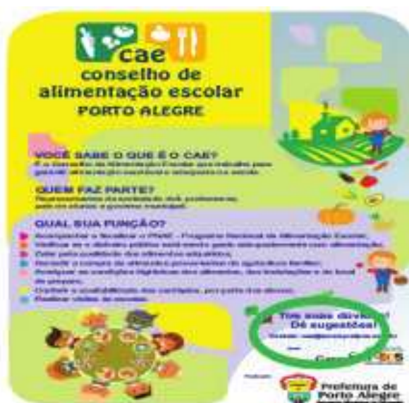
Figura 3: Imagem do cartaz Informativo