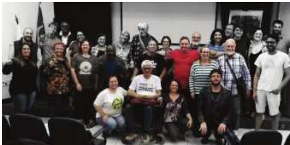
Figura 3: Seminário FMCC

Passadas três décadas, atualmente se vive no país e em nível global uma conjuntura muito distinta do cenário político dos anos de 1990. No Brasil, sofrem um grande revés a