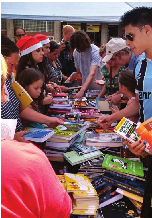
Figura 3: Natal Literário em frente a Prefeitura de Porto Alegre

Em 2014, foi realizado a 1ª Edição do Natal Literário, em parceria com o Banco de Livros, que consistia a doação cerca de 2000 livros em frente a Prefeitura de Porto Alegre. Os recursos disponíveis foram destinados a contratação de contadores/mediadores de leitura e para a aquisição de acervo para os projetos Encantando com histórias, Baú de Histórias: Era uma vez... e para as Bibliotecas Josué Guimarães (BPMJG), Ramal Restinga, SMAM, Emílio Meyer e Liberato Salzano Vieira da Cunha. Esse ano era um investimento de R$160.000,00 porém foram liberados somente R$ 39.051,00.