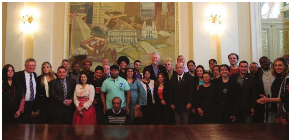
Figura 2: Sanção do Plano Municipal de Cultura, Paço Municipal, 15/09/2015

A crise decorrente da pandemia atingiu sobremaneira a classe cultural justamente porque suas atividades são voltadas para o público, o que em grande medida incide na aglomeração de pessoas. Tendo isso em vista, a atuação do conselho tem focado no auxílio aos trabalhadores e trabalhadoras da cultura, que vai desde a distribuição de cestas, a pressão por editais, pela existência de renda básica, por benefícios para quem trabalha, bem como locais de produção cultural e construção de estratégias para depois do isolamento, até a elaboração de manifestos e leis que garantam apoio ao setor.