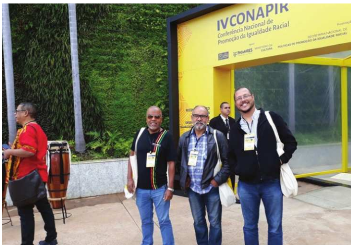
Figura 1: Participação do CNEGRO na IV CONAPIR

Alegre. Desse modo, quando um grupo age em desfavor de outro grupo, em ações discriminatórias e racistas, o CNEGRO insurge-se dentro do seu campo de atuação em respostas a estes atos.