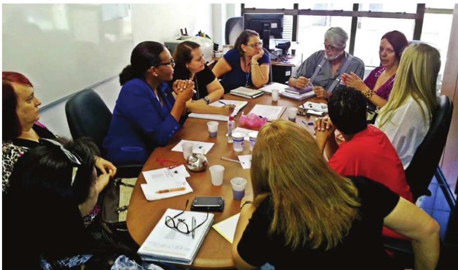
Figura 2: CMDH inicia debate para a construção da V Conferência Municipal de Direitos Humanos de Porto Alegre.

por retomar a realização das conferências municipais, que não ocorriam desde o ano de 2007. Essa conferência ocorreu em fevereiro de 2016 e foi preparatória para a Conferência Estadual e Nacional de Direitos Humanos.