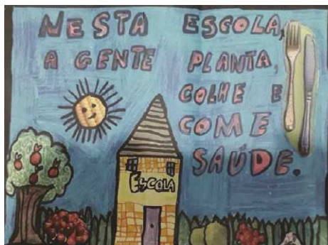
Figura 5: Imagem do cartaz de divulgação do vencedor do concurso

O objetivo do concurso era que os educadores trabalhassem o tema alimentação saudável nas escolas, segundo a resolução 26/2013 do PNAE. Dentre os objetivos específicos do concurso estavam: incentivar que os alunos frequentassem o refeitório e consumissem a alimentação da escola, evitando que trouxessem de casa lanches, e que, caso trouxessem que fossem saudáveis; conscientizar professores, funcionários, pais e comunidade escolar sobre a importância da adoção de pequenas mudanças nos hábitos diários, sendo exemplo aos alunos; incluir a alimentação saudável como um conteúdo transversal permanente das áreas do conhecimento. O concurso se destinou à criação de um cartaz, por escola, que descrevesse uma frase e desenho ou figura que representasse o que era alimentação saudável na escola.