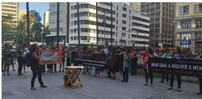
Figura 3: Campanha 16 Dias de Ativismo pelo Fim da Violência Contra as Mulheres, 25 de novembro de 2019