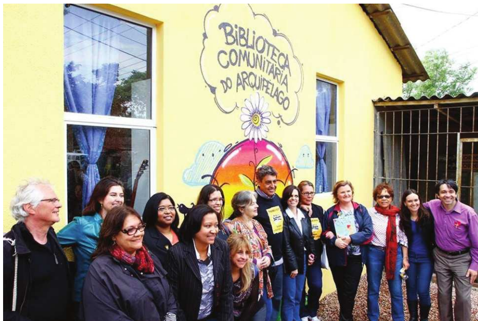
Figura 2: Inauguração da Biblioteca Comunitária do Arquipélago

A Biblioteca Comunitária do Arquipélago integrou novos parceiros e financiadores ao projeto e promovia atividades como consulta e empréstimo de livros, saraus, mediações de leitura, sempre atendendo ao público da comunidade e as instituições locais, como escolas e postos de saúde. Porém, atualmente a biblioteca está com suas ações suspensas por tempo indeterminado, devido à construção da nova ponte do Guaíba, que desalojou famílias e equipamentos culturais na Ilha Grande dos Marinheiros, incluindo a Biblioteca do Arquipélago. Para a implantação da Biblioteca do Arquipélago, a Prefeitura destinou R$ 91.140,00 em reformas e equipamentos e R$ 8.000,00, foram utilizados na aquisição de acervo e para a realização dos projetos: ação realizada pela Secretaria Municipal de Cultura o “Encantando com histórias” no Hospital Materno Infantil Presidente Vargas e a ação realizada pela Secretaria Municipal de Educação em escolas conveniadas o “Baú de Histórias: Era uma vez...”, totalizando assim R$ 99.140,00.