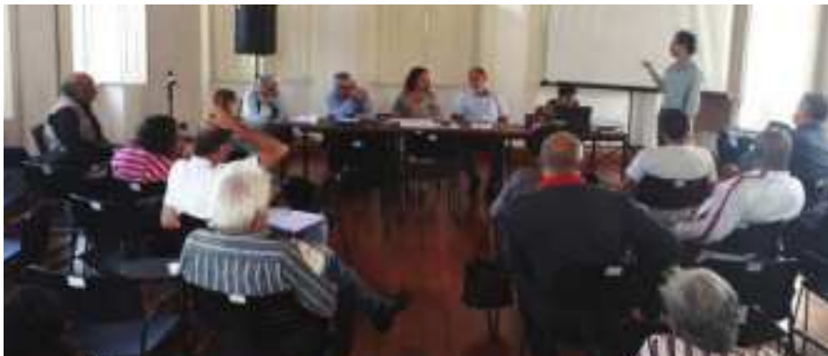
Figura 2: Plenária na Casa Dos Conselhos

No ano de 2019 o FMCC seguiu com suas reuniões plenárias e ações conjuntas. Em 12 de março 2019, foi apresentada a sistematização da pesquisa realizada pelo FMCC. Dezenove conselhos municipais responderam ao questionário, do qual constavam as seguintes questões: