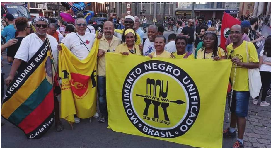
Figura 2: Participação do CNEGRO em eventos de 13 de maio

significativo na valorização da educação e cultura, resgatando valores dos nossos antepassados.