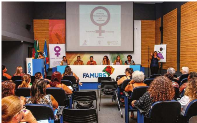
Figura 1: Lançamento da Conferência Municipal de Políticas para Mulheres, 12 de março de 2020