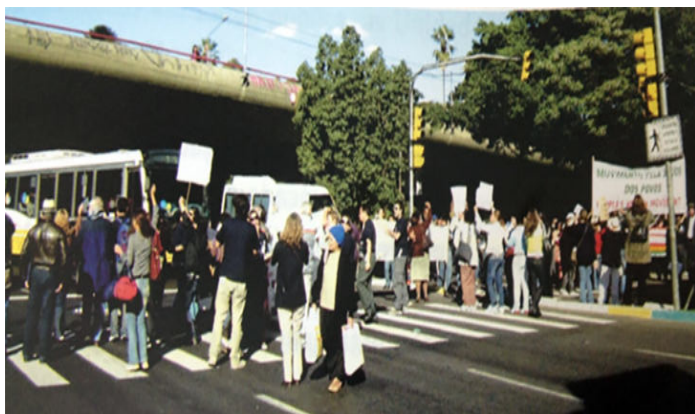
Figura 1. Manifestação em defesa do SUS, com participantes do Curso da Universidade pela Saúde dos Povos em Porto Alegre, juntamente com o Conselho Municipal de Saúde, em setembro de 2008.

Após um longo tempo de reflexões e discussões sobre como colocaríamos nosso projeto em prática, decidimos que a identificação dos casos de ação comunitária, que também chamamos de episódios, seria feita em parceria com o Conselho Municipal de Saúde (CMS) de Porto Alegre. Isso porque a trajetória e as lutas do CMS eram muito afins às do MSP, e muitos casos expressivos de ação comunitária haviam transitado por esse espaço. Além disso, o MSP tinha participado, havia pouco tempo, de uma manifestação organizada pelo CMS em defesa da saúde pública. A manifestação ganhou expressão com a participação dos mais de 50 ativistas do MSP, vindos de vários países do mundo por ocasião do curso da Universidade Internacional da Saúde dos Povos, realizado em Porto Alegre em setembro de 2008.