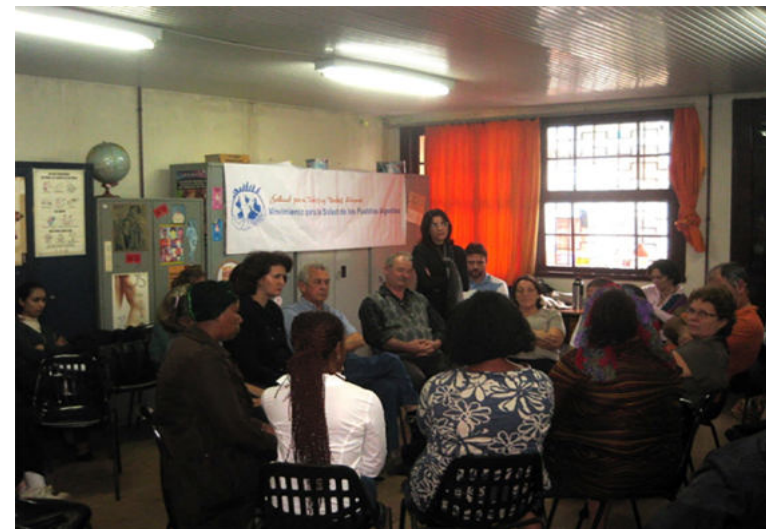
Figura 3. Primeiro encontro participativo entre pesquisadores, participantes e observadores, em agosto de 2011.

Esse encontro possibilitou, a partir do seu conteúdo, construirmos coletivamente os pontos de análise e a sistematização da pesquisa, conforme descrito no 5º momento.