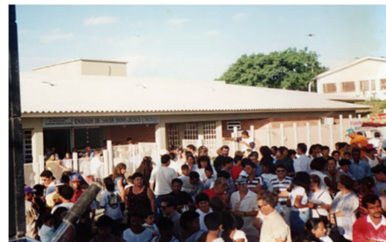
Figura 7. Inauguração da Unidade de Saúde da Bom Jesus em janeiro de 1996.