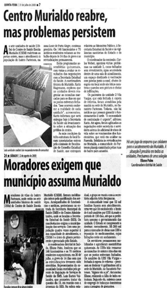
Figura 12. Reportagens de jornal local, versando sobre os problemas institucionais e as demandas dos usuários da região.

As Figuras 12 e 13, a seguir, mostram algumas notícias veiculadas sobre o episódio do Murialdo.