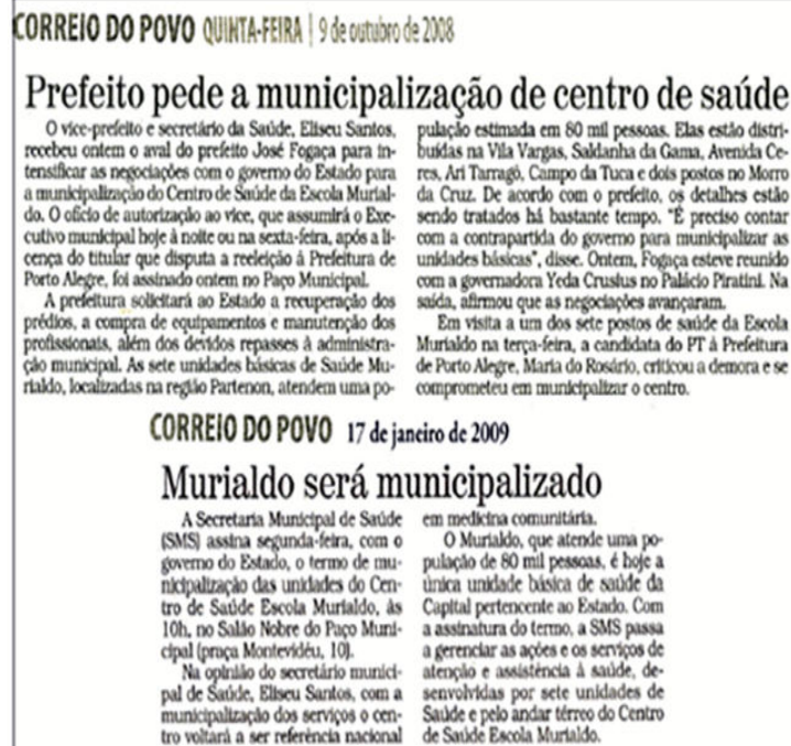
Figura 13. Reportagens veiculadas em jornal local, sobre os desfechos da municipalização das UBS do Murialdo.