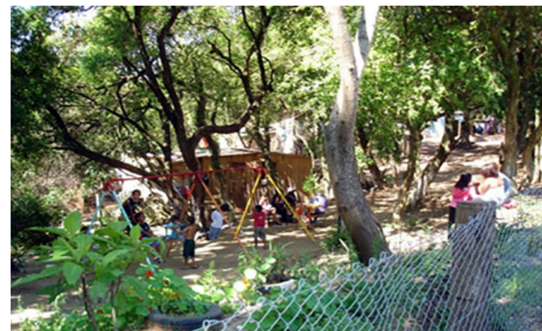
Figuras 11. A mesma praça ganhou um belo jardim (2012).