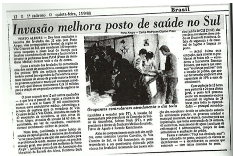
Figura 6. Notícia do Jornal Brasil , de 15/09/1988.