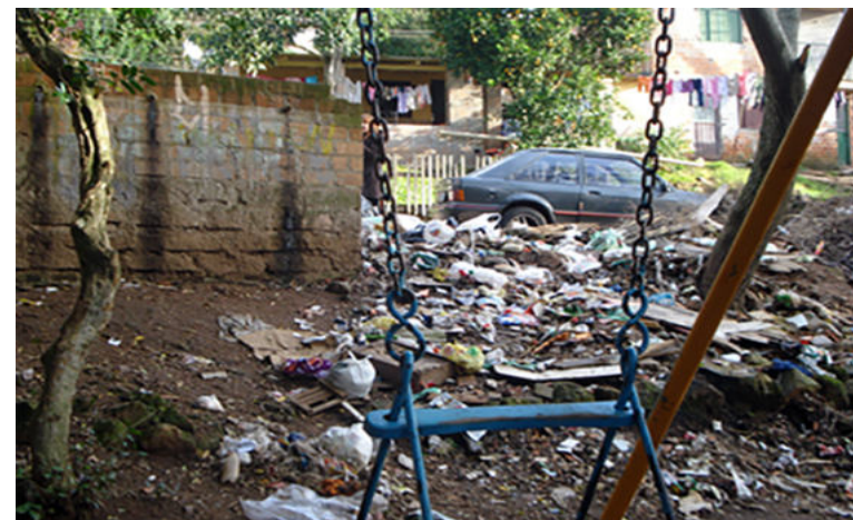
Figuras 10. A praça, antes cheia de lixo (2009).