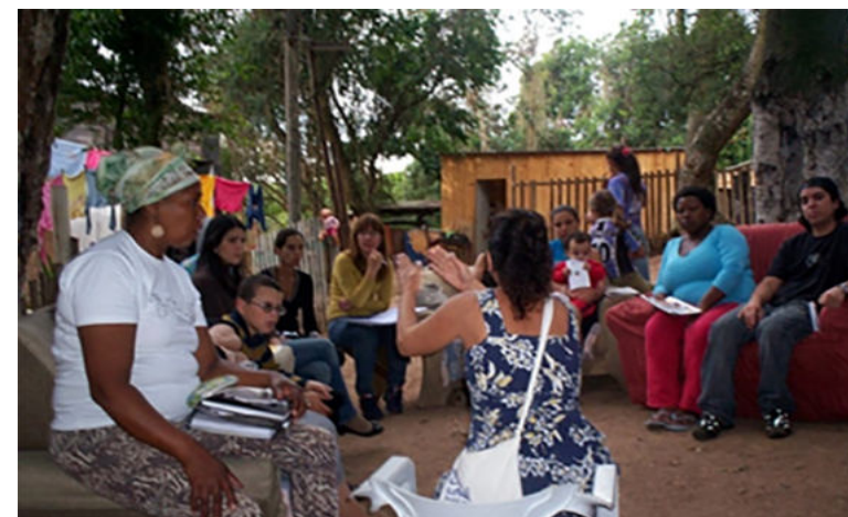
Figura 8. Reuniões itinerantes.