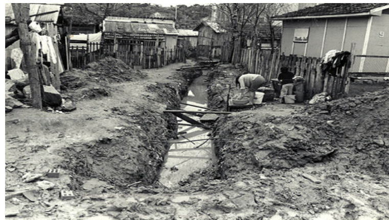
Figura 5. Falta de saneamento básico na Vila Cruzeiro no final da década de 1980.