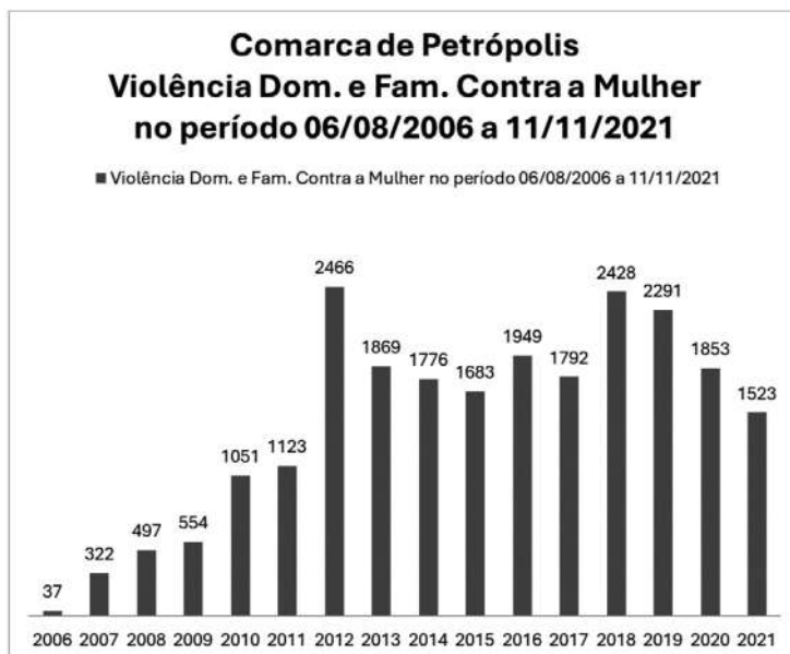
Gráfico 1. Apresentação da evolução do registro da violência contra mulher no município de Petrópolis no período de 2006 a 2021